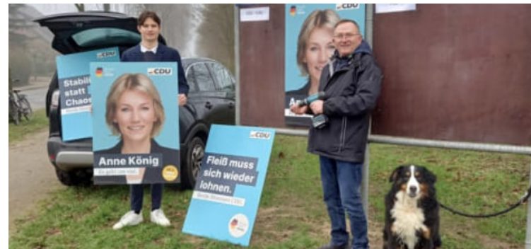
JU unterstützt im Wahlkampf

Wie kann man bei euch mitmachen? Wo können sich Interessierte melden? „Über die Webseite der CDU Heiden findet man auch die JU. Sonst kann man uns über Instagram oder per email ( lucwanning@web.de ) anschreiben.“